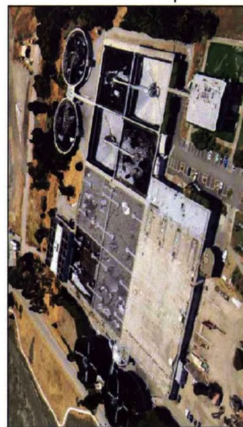
Palo Alto Regional Water Quality Control Plant Planta de control de la calidad del agua regional de Palo Alto

San Francisco Bay Bahía de San Francisco