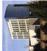
Educational office medical Médico oficina educativo